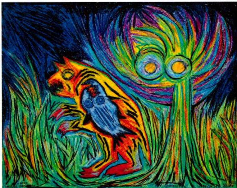
כנרת, 1986, פסטל שמן על נייר, 80x70 ס"מ

מקור הדימויים והצבעוניות הוא האדמה, כמו בציור קיר. גרובמן מנסה בדרך זו, להעניק לציוריו אופי של קדושה, בדומה לציורי הקיר במבנים קדושים, מקדשים, כנסיות וכד'. הציורים מוקפדים מאוד והם ניסיון של האמן להחזיר לציור את התכנים הפוליטיים החברתיים והמיסטיים שאבדו לו במעבר מהיכל הקדושה, קרי המוזיאון, לחוצות הערים, תפקיד שניכס לעצמו הגרפיטי. בתערוכה זו האמן מטעין בציוריו את אותם מוקדי כוח שבזכותם זכה הגרפיטי להכרה אמנותית, דהיינו המחאה הפוליטית והחברתית, ומחזירם מחדש לתוך החלל המסורתי של האמנות - המוזיאון.