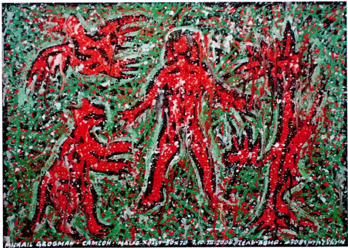
שמשון הגיבור, 2006, שמן על בד, 70 x 50 ס"מ