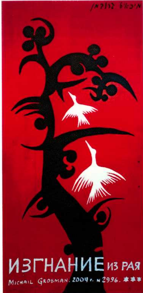
גירוש מגן עדן, 2004 שמן על דיקט, 140 x 69.5 ס"מ

תערוכתו הנוכחית של גרובמן במוזיאון בר דוד בברעם, היא קבוצת ציורים שהציר המחבר ביניהן הוא תמאטי, מיסטיקה יהודית, כוחות הפועלים על נפש האדם, כל זאת מתוך ביטוי היותו אמן ישראלי עכשווי. במידה רבה ניתן להתייחס לתערוכה זו כאל סוג של נבואה, ובה כמיהה אל המימד הרוחני, מטפיזי, מתוך ההקשר הפוליטי והחברתי של המציאות הישראלית. בבחינת תפקידו של האמן, גרובמן דוחה את האפשרות של ההיסטוריון המפרש באמצעות האמנות את מהלך ההיסטוריה. הוא נוטל על עצמו את תפקיד הנביא כבומרסטר חברתי ופוליטי, כשהמימד המוסרי הינו אמצעי לזיכוך רוחני.