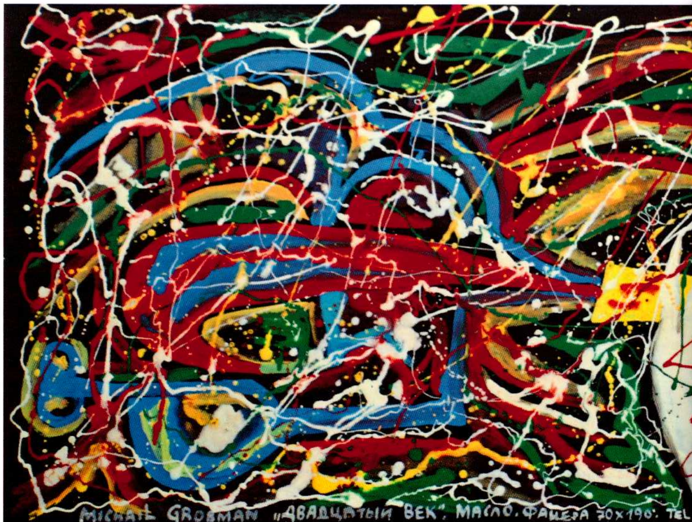
МИХАИЛ ГРОСМАН «ДВАДЦАТЫЙ ВЕК», МАСЛО, ФАЦЕРА 70x190, ТЕТ