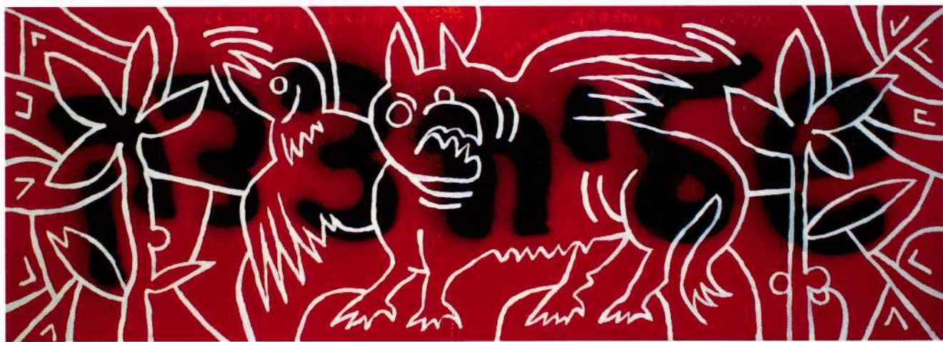
שליח צדק, 2003, שמן על דיקט, 190 x 70 ס"מ