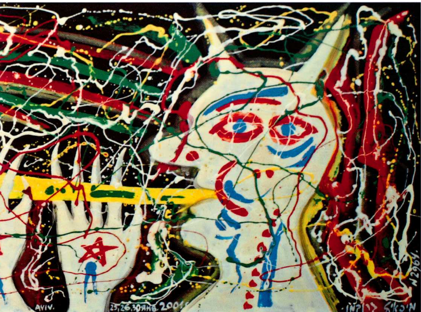
המאה ה-20, 2001, שמן על דיקט, 190 x 70 ס"מ