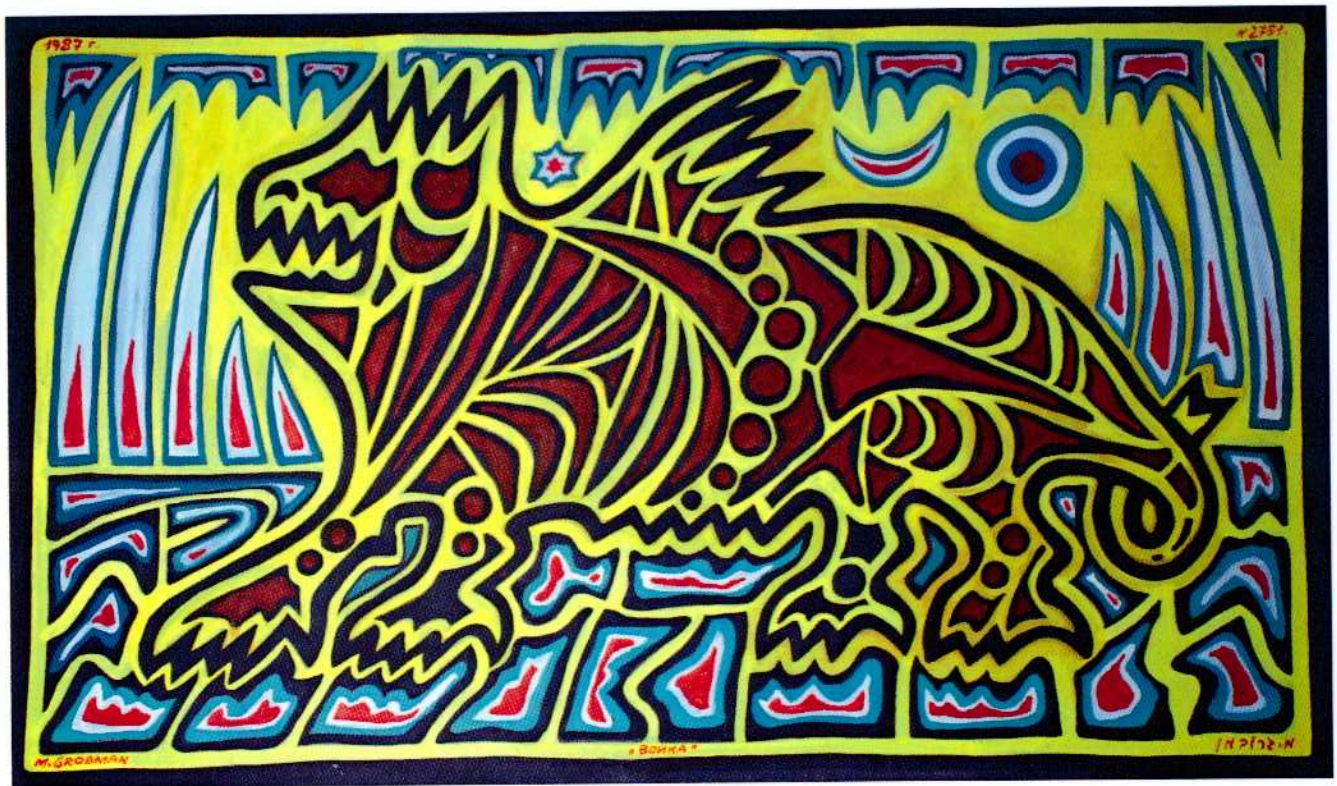
מלחמה, 1987, גואש על נייר, 70 x 100 ס"מ